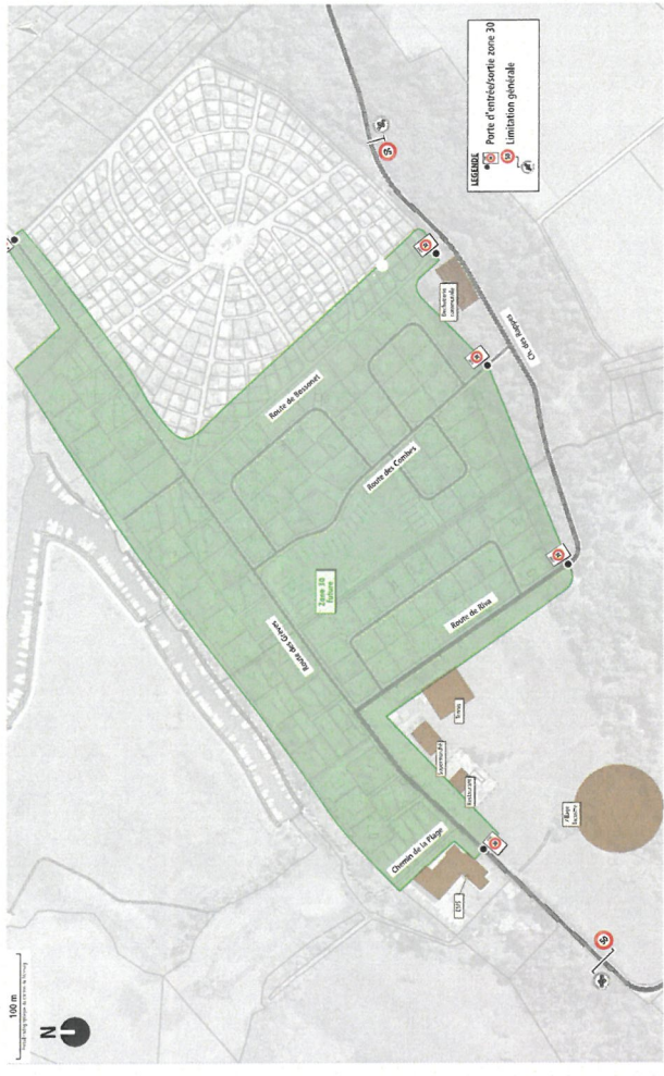
Extension de la zone 30